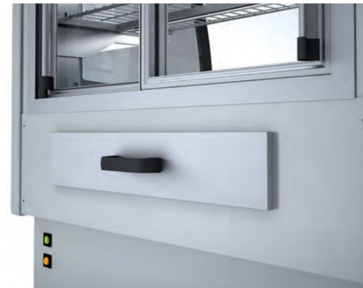
Detalle cajon trasero humidificador (Disponible gama WV y VVA) Detail rear humidifier drawer (VV and VVA range available) Détail tiroir arrière humidificateur (Gamme WV et VVA disponible)