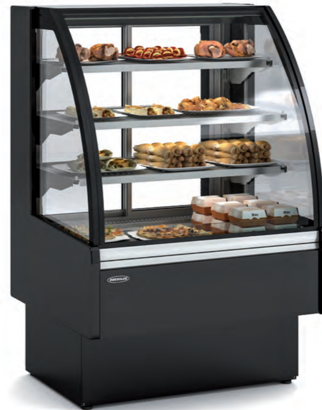
VV-6HE-9-C Total lacado Total lacquered Laqué total